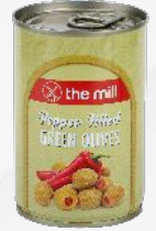
Çekirdeksiz Yeşil Zeytin Biber Dolgulu Yeşil Zeytin (361-400 adet/kg)