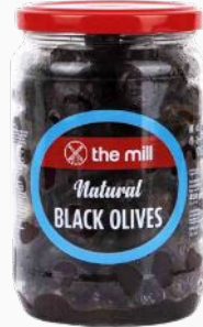
Doğal Siyah Zeytin (291-350 adet/kg)