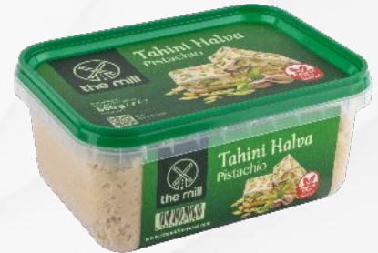
Antep Fıstıklı Tahin Helvasi