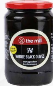
Fit (%2 Tuz) Siyah Zeytin (230-290 adet/kg)