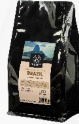
Brazil Yellow Bourbon