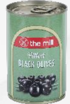
Çekirdeksiz Siyah Zeytin (361-400 adet/kg)