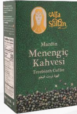
Mardin Menengiç Kahvesi