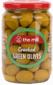
Kırma Yeşil Zeytin (141-160 adet/kg)