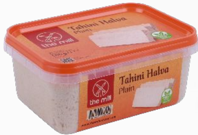
Sade Tahin Helvasi