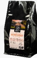
Honduras Finca Cerro Azul