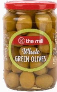
Kokteyl Yeşil Zeytin (111-140 adet/kg)