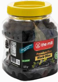
Premium Doğal Fermente Siyah Zeytin (Boy: XS ve L)