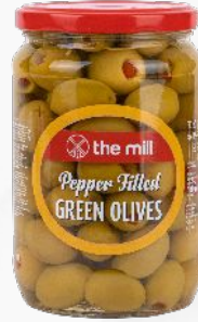
Biber Dolgulu Yeşil Zeytin (181-230 adet/kg)