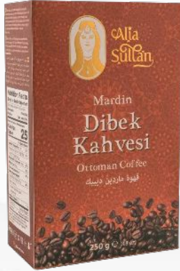
Mardin Dibek Kahvesi